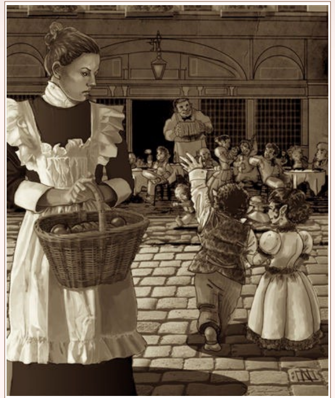
„Fantastisch“, kommentiert Smith.

Ein wenig Rollenspiel oder eine Probe auf Recherche oder Straßenwissen mit SG 10 verweist die Charaktere nach Quirinale, den berüchtigten Scyllianischen Stadtteil. Bei einer Steigerung geben Sie den Spielern einen weiteren Hinweis: Eine hastig geschriebene Rechnung von „ Maricellos Delikatessen “ in der Flour Street (im Herzen von Quirinale), die aus der Einkaufstasche fällt.